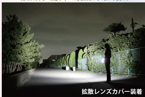
拡散レンズカバー装着

付属品の拡散レンズカバーを装着することで、夜間作業などに最適な均一の光を照射することができます。