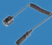
リモートスイッチ 型式：RG9-RSW