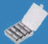
RG専用18650 リチウムイオンバッテリーセット 型式：RG18650-4PCS