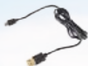
USB充電ケーブル (DC5V 2Aまで) Micro USB Type-B 型式：RG9-MUB-CB