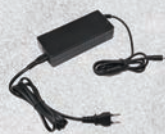
AC充電器 (AC100V~240V) 型式：ACCH-40