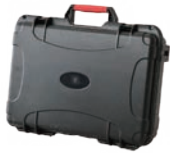
専用ボックス (型式：BSWP-3050WP)